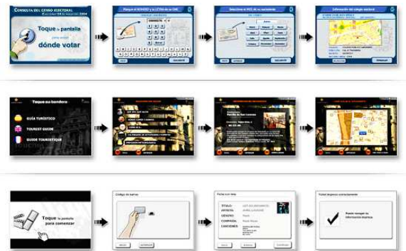
Desarrollo de aplicaciones personalizadas rápido y fiable

También disponemos de un KIT SDK con un completo manual de desarrollo para utilizar directamente la API de SOC 9000 desde otros lenguajes de programación para el desarrollo de aplicaciones (C++, Visual Basic, etc).