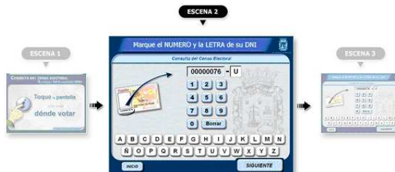
Definición de relaciones entre escenas

Crear una aplicación por compleja que sea es tan sencillo como crear la estructura o esqueleto de la aplicación y a continuación definir de forma gráfica las propiedades y relaciones entre cada una de las escenas que la componen (efectos visuales y de transición de pantalla, forma y posición de los botones y otros elementos, elección de los tipos de letra, elementos gráficos, tamaños, colores, etc.)